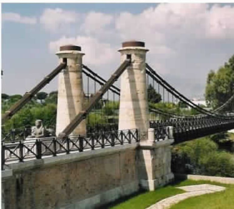
by camillo linguella