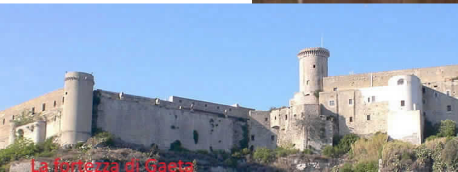
La fortezza di Gaeta