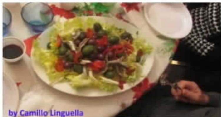
by Camillo Linguella

Involentino di carne cruda con cavolo cappuccio alla sola e Antipasto della tradizione Timballo di carciofi e ricotta Polpetta di bollito croccante e salsa verde Millefoglie di pane carasau, malonese al tartufo nero e verde Primo Cavatelli con pesce spada, agrumi e mollica di pane Secondo Cuoppo di calamari e gamberi Contorno Misticanza con finocchi, arance e olive Patate sauté Dolce Babà al rum, lemon tart e spuma agli agrumi Dolci della tradizione